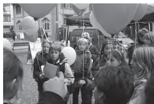
Die Kinder haben Rechte - im vergangenen Jahr wurde mit einer Aktion darauf aufmerksam gemacht.