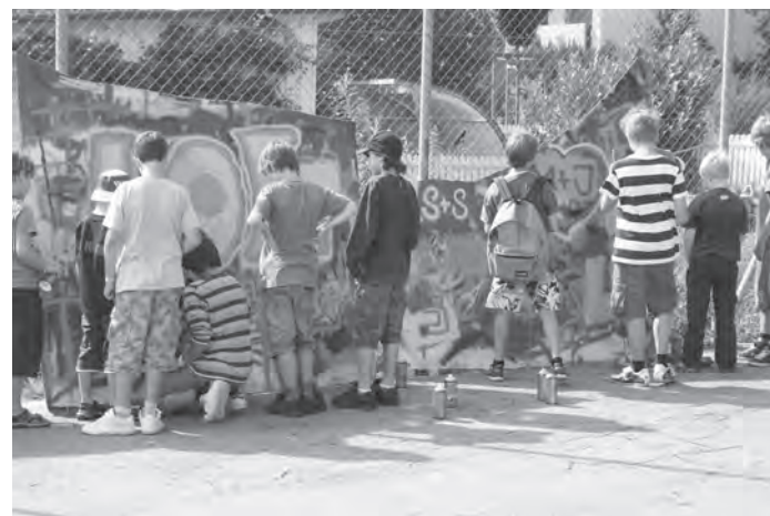
Die Jungs unter sich anlässlich des Festes „Gielewälte“ im Schlossmatt-Schulhaus.