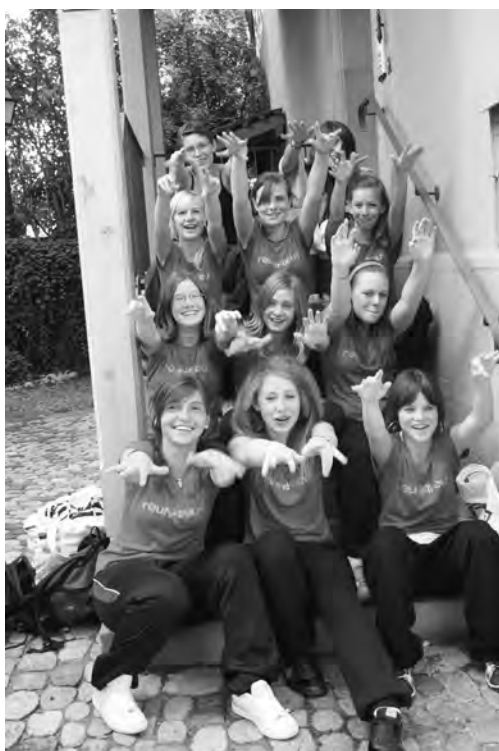
Die neugegründete roundabout-Gruppe.

Mit dem Kulturschopf, den die Stadt Burgdorf seit Sommer 2007 für die Jugend mietet, wurden den Jugendlichen und jungen Erwachsenen weitere Räume für private Veranstaltungen zur Verfügung gestellt. Je nach Art und Grösse des Anlasses fand dieser im Jugend-