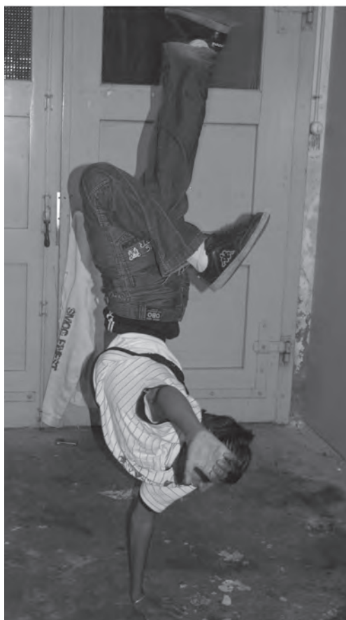
Auftritt eines Gastes am Treff-Fest.

Krauchthal und Mötschwil) beschränkten wir uns auf die zwei grösseren Zentren Hindelbank und Krauchthal. Dort gab es unter anderem zwei Discos, den Sportanlass „Halle für Alle“ und einen Kinoabend. ■