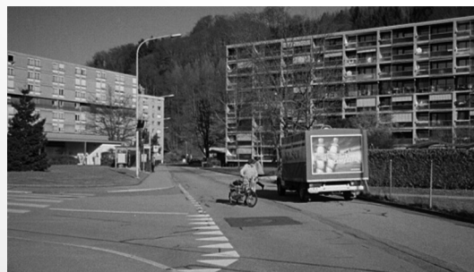
Fahrdynamische Strassenanlage – aber im Quartier will man nicht nur möglichst schnell durchfahren!

Die Studie wurde im April 2004 abgeschlossen. Die Resultate sind im Herbst 2004 in das Projekt «Tempo 30 flächendeckend in den Wohnquartieren der Stadt Burgdorf» eingeflossen.