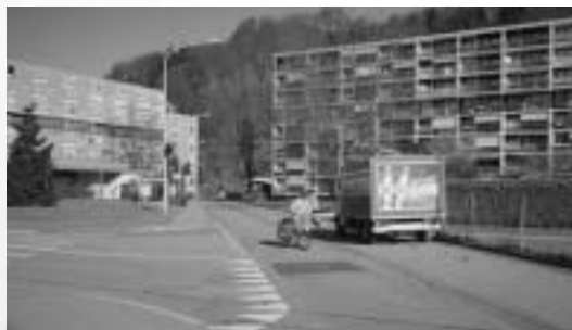
Un aménagement routier qui permet d'aller vite – mais tout le monde ne souhaite pas forcément traverser le quartier à toute allure!

L'étude a pris fin en avril 2004. Ses résultats ont été intégrés en automne 2004 dans le projet visant à généraliser la limitation à 30 km/h dans les quartiers résidentiels de Berthoud.