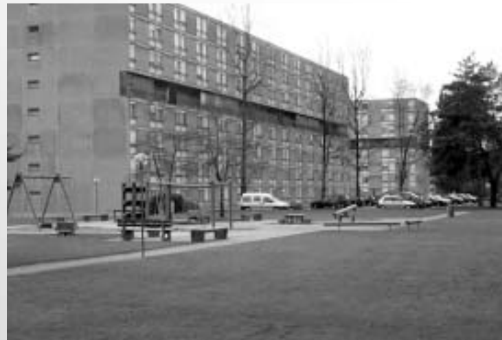
Le quartier du Gyrischachen

Entré dans sa seconde phase, le projet FuVeMo s'est notamment donné pour objectif d'améliorer et de mettre en valeur certains quartiers périphériques de Berthoud. Dans l'un de ceux-ci, le Gyrischachen, un quartier construit pour la voiture dans les années soixante, la situation de la circulation piétonne a été étudiée. Avec la volonté qu'il devienne possible de s'y déplacer sans peine à vélo et à pied, tant à l'intérieur du quartier que sur ses liaisons vers l'extérieur.