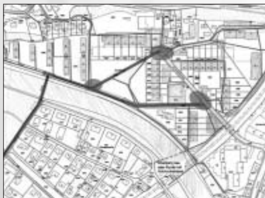
Catalogue des mesures proposées: grand axe du projet, ramifications, placettes

Participe au projet GrobPlanung GmbH, Herzogenbuchsee