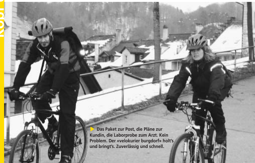
► Das Paket zur Post, die Pläne zur Kundin, die Laborprobe zum Arzt. Kein Problem. Der «velokurier burgdorf» holt's und bringt's. Zuverlässig und schnell.

Bei der Tiergartenunterführung ist eine Querrung des Gütergleises Aebi unumgänglich. Eine Knacknuss für das Projekt Velohochstrasse.