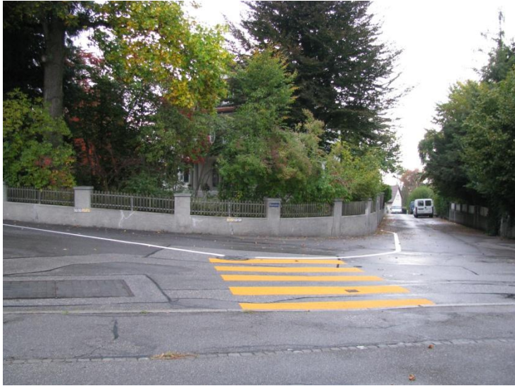
Abb.1: Neue Fussgängerquerung Jungfraustrasse / Blumenweg