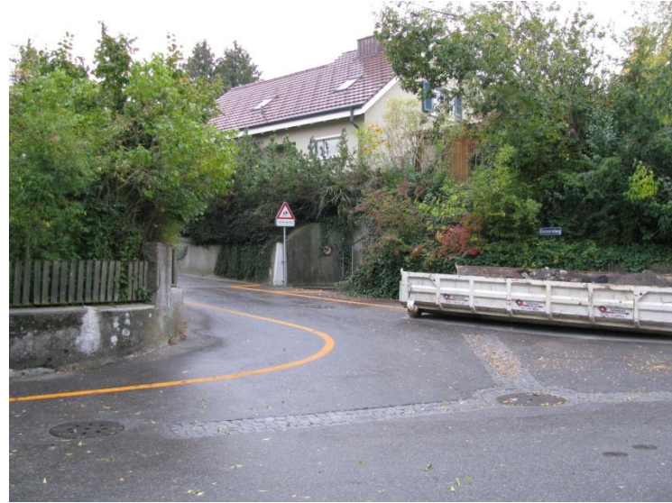
Abb.2: Sicherung Kindertartenaufgang Chasseralweg / Weissensteinstr.