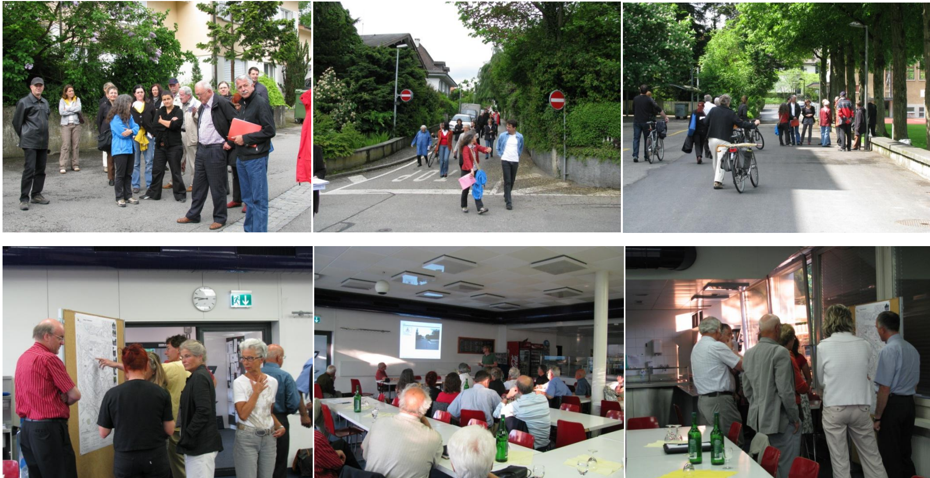
Abb. 3-8: Öffentliche Begehung / Informationsanlässe im Quartier

Die öffentliche Begehung des Quartiers wie auch die folgenden zwei Informationsanlässe zeigten, dass das Projekt auf grosses Interesse in der Quartierbevölkerung stösst. Gegen 50 Personen nahmen an dieser ersten Veranstaltung zur Verkehrsberuhigung im Quartier Gsteig teil. Verkehrsplaner und Vertreter der Stadt führten durch das Quartier und nahmen sämtliche Eingaben der Bewohner auf.