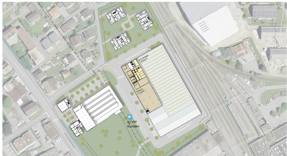
Abb. 1: Bebauungsstudie (Rykart Architekten, Juni 2018)

Auf dem Areal der heutigen Supermarkt-Filiale resp. des zugehörigen Parkplatzes soll neu nördlich gelegen eine Überbauung mit voraussichtlich rund 35 Wohnungen entstehen.