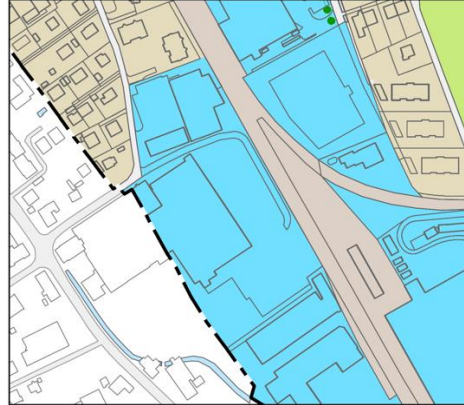
Ausschnitt gültiger Zonenplan