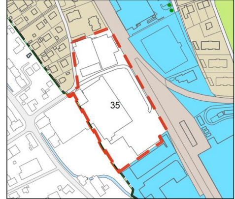
Abb. 3: vorgesehene Zonenplanänderung (neu ZPP 35)