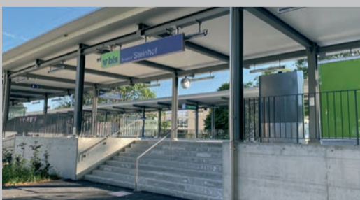
Der neue, 2021 eröffnete, um 250 Meter Richtung Oberburg versetzte S-Bahnhof mit zwei hindernisfreien 150 m langen Perrons.