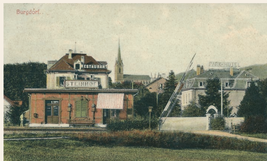
Die erste Haltestelle im Steinhof. 1899 erbaut für «Gepäck und Personen».