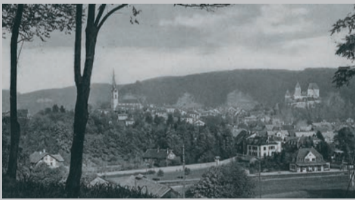
Der zweite Bahnhof im Steinhof; Baujahr 1924