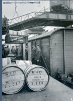
Von der Bahn aufs Schiff