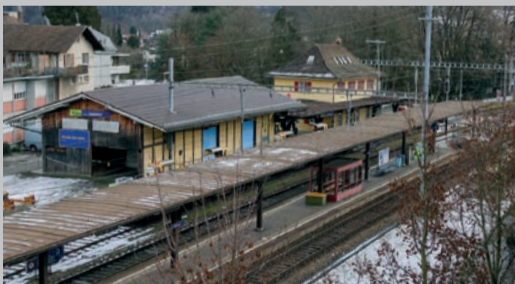
Der umgebaute und um einen Güterschopf ergänzte Bahnhof Steinhof