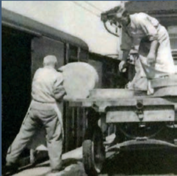
Bahnverlad von Käse in Langnau

Dank dem Eisenbahnbau konnte sich das Emmental von einer landwirtschaftlich geprägten Region zu einer Dienstleistungs- und Industrieregion entwickeln. Dieses neue Selbstbewusstsein und der Anschluss an die «weite Welt» ermöglichte den Export von Käse, Textilien, Industriegütern und nicht zuletzt auch Bier ins benachbarte Ausland und nach Übersee.