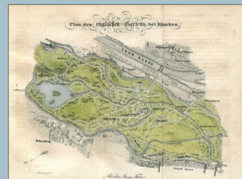
Nach englischem Vorbild: Der «Englische Garten» in München. Angelegt als Militärgarten, 1789 zum Volkspark umgestaltet und als einer der ersten Parks in Europa für die gesamte Bevölkerung geöffnet.